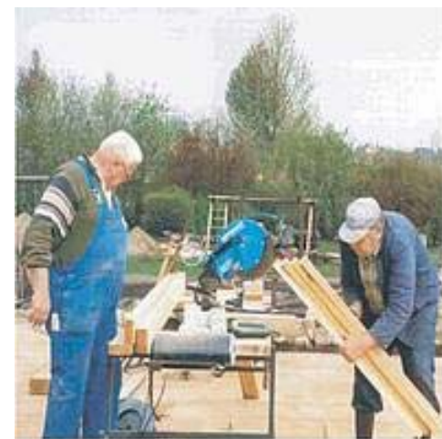
Kosteneinsparung durch Eigenleistung