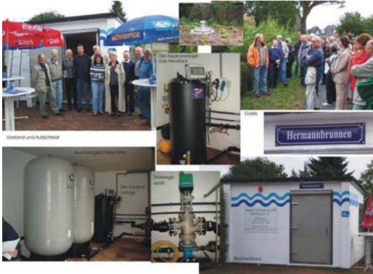
Vorstand und Aufsichtsrat